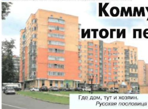
Где дом, тут и хозяин. Русская пословица